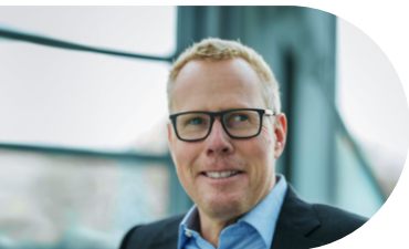
🔗 Kerk Behrens